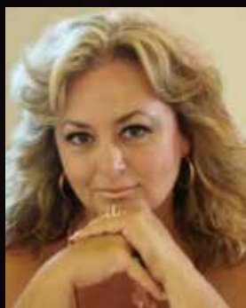
カルメン・アパリシオ (フローリア・トスカ)